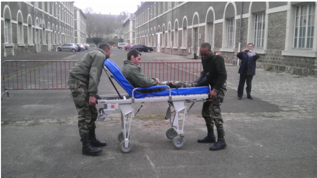
Service de santé de l'armée de terre