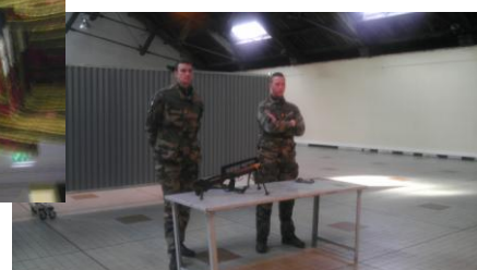
Démonstration démontage Famas et pistolet