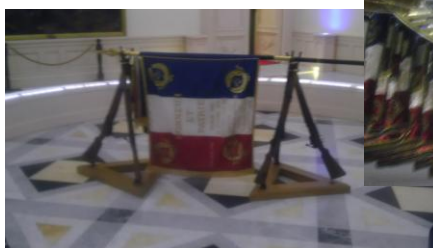
La salles des étendards