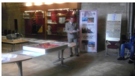
L'histoire française des médailles de guerre