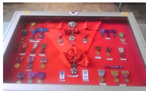
Médailles de guerre et Légions d'honneur